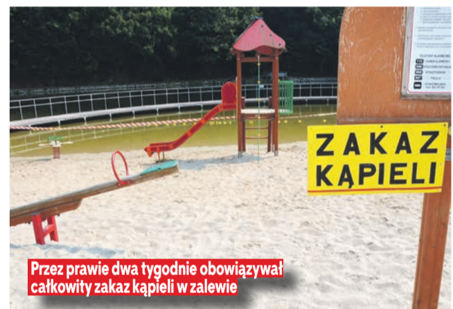
Przez prawie dwa tygodnie obowiązywał całkowity zakaz kąpeli w zalewie