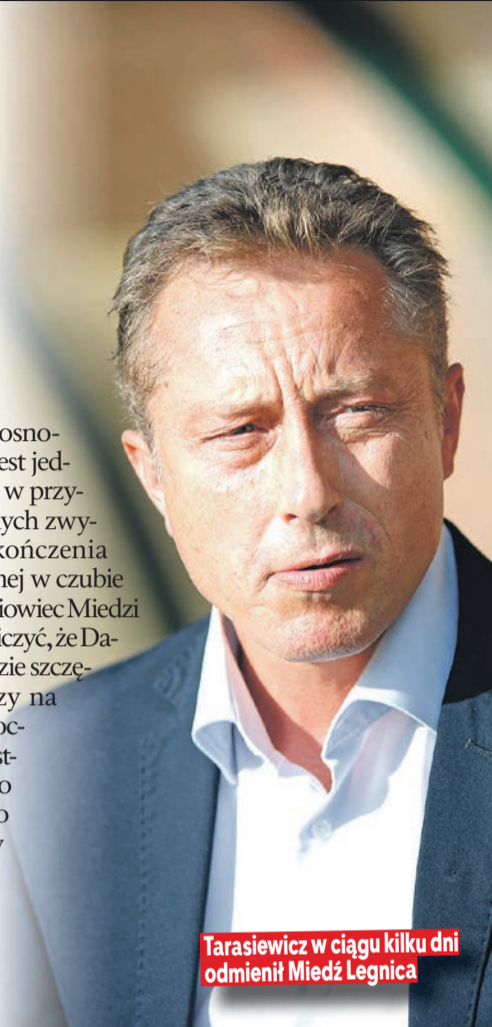
Tarasiewicz w ciągu kilku dni odmienił Miedź Legnica