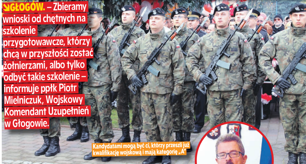
Kandydatami mogą być ci, którzy przeszli już kwalifikację wojskową i mają kategorię „A”