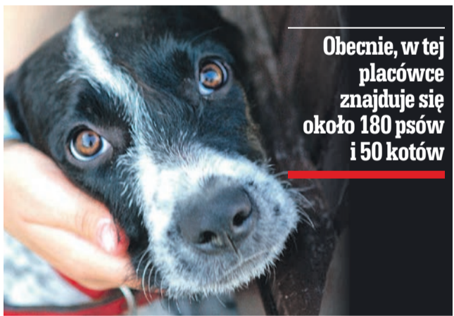
Obecnie, w tej placówce znajduje się około 180 psów i 50 kotów