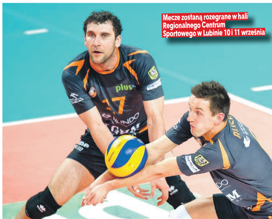
Mecze zostaną rozegrane w hali Regionalnego Centrum Sportowego w Lubinie 10 i 11 września