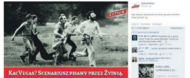
KAC VEGAS? SCENARIUSZ PISANY PRZEŻ ŻYTŃIĄ.