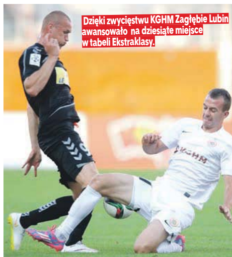
Dzięki zwycięstwu KGHM Zagłębie Lubin awansowało na dziesiąte miejsce w tabeli Ekstraklasy.