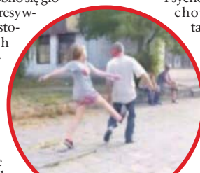
Nastolatki swój atak agresji opublikowały w Internecie. Kiedy wokół sprawy zrobiło się głośno, na krótko trafiły do policyjnej izby dziecka.