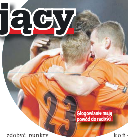
Głogowianie mają powód do radości.