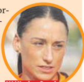
W Kindze Grzyb pokładane są wielkie nadzieje.