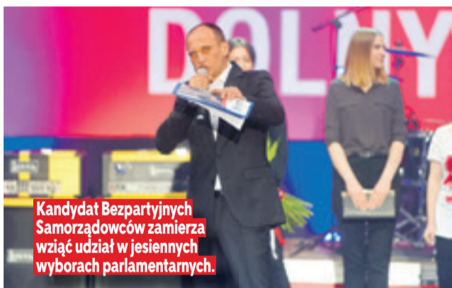
Kandydat Bezpartyjnych Samorządowców zamierza wziąć udział w jesiennych wyborach parlamentarnych.

LUBIN. Takiego wieczoru wyborczego jeszcze nie było. Kandydat na prezydenta RP, muzyk Paweł Kukiz urządził największą tego typu imprezę widowiskowo-sportową Regionalnego Centrum Sportowego w odległym od stolicy Lubinie, do której zaprosił wszystkich swoich sympatyków z zespołami Złe Psy, Thermit i Steel Fire. Po raz pierwszy wieczór wyborczy kandydata ubiegającego się o najwyższy urząd w państwie odbył się w Lubinie.