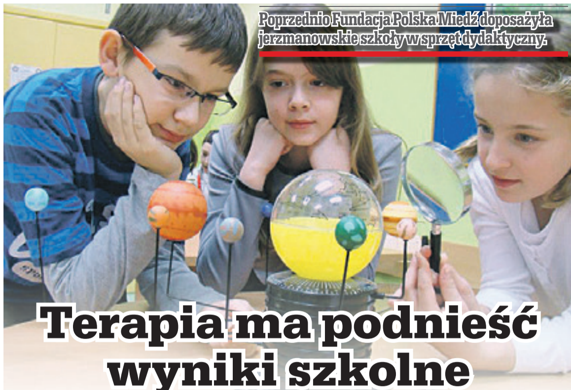
Poprzednio Fundacja Polska Miedź doposażyła jerzmanowskie szkoły w sprzęt dydaktyczny.