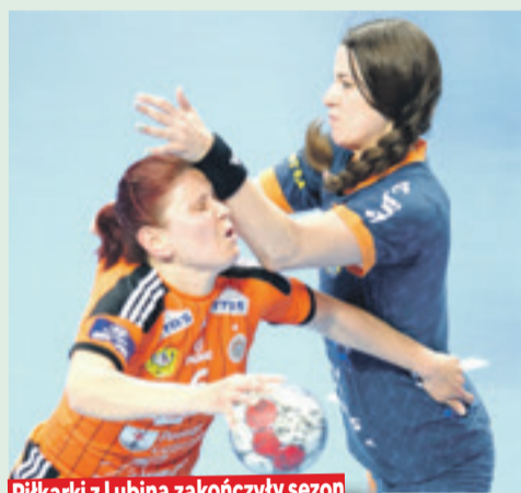
Piłkarki z Lubina zakończyły sezon na piątym miejscu.