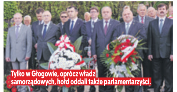
Tylko w Głogowie, oprócz władz samorządowych, hołd oddali także parlamentarzyści.