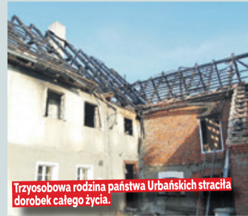
Trzyosobowa rodzina państwa Urbańskich straciła dorobek całego życia.

Pomoc rodzinie można również wpłacać na konto: Andrzej Urbański; Rokitnica 40; 59-500 Złotoryja, EuroBank 63 1470 0000 22 000 81 36 2000 0001. Dary można przekazywać za pośrednictwem Stowarzyszenia „Nasze Rio”. Kontakt z Iwoną Pawłowską pod numerem telefonu 607-375-111 oraz z Pawłem Zabłotnym – telefon: 697-422-215. (JW)