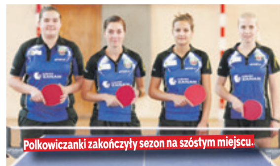
Polkowiczanki zakończyły sezon na szóstym miejscu.