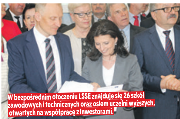
W bezpośrednim otoczeniu LSSE znajduje się 26 szkół zawodowych i technicznych oraz osiem uczelni wyższych, otwartych na współpracę z inwestorami.

Uroczystość podpisania listu intencyjnego, powołującego Dolnośląski Klastr Edukacyjny Legnickiej Specjalnej Stre-