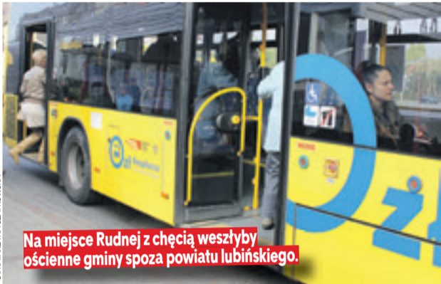
Na miejsce Rudnej z chęcią weszłyby ościennie gminy spoza powiatu lubińskiego.

LUBIN. Rady gmin miejskiej i wiejskiej Lubin oraz Ścinawy wyraziły zgodę na wprowadzenie bezpłatnej komunikacji międzygminnej w powiecie. Wyłamała się jedynie Rudna. Pierwszy przetarg na operatora odbędzie się jeszcze w kwietniu.