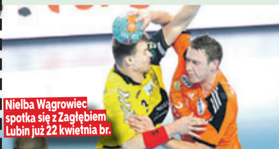
Nielba Wągrowiec spotka się z Zagłębiem Lubin już 22 kwietnia br.