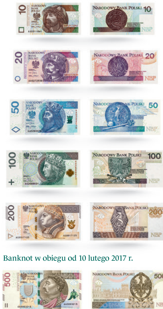
Banknot w obiegu od 10 lutego 2017 r.