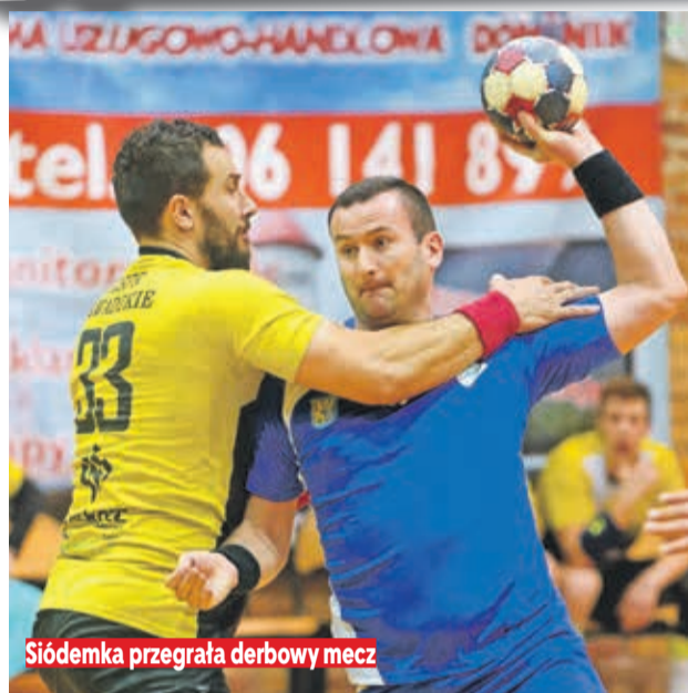
Siódemka przegrała derbowy mecz

Spotkanie ze Stalą rozpoczęliśmy na wysokich obrotach. Graliśmy to, co sobie założyliśmy przed meczem i na tablicy w 10. minucie widniał wynik 7:2 dla nas. Wtedy mieliśmy przerwę, wkraśli się błędy i liczne kary, przez co połowa skończyła się 13:9 dla Mielca. Drugą połowę zaczęliśmy równie dobrze jak pierwszą, dochodząc Stal na remis. W końcówce meczu było bardzo du-