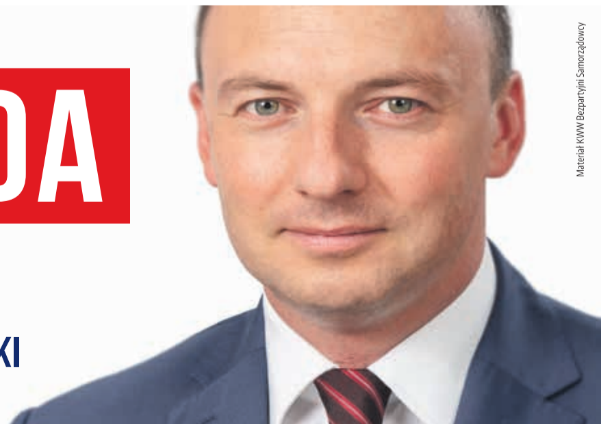
Materiał KWW Bezpartyjni Samorządowcy

KANDYDAT DO SEJMIKU WOJEWÓDZTWA NR 1 OKRĘG LEGNICKI